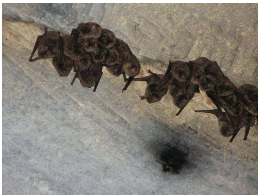
Groupe de Minioptères de Schreibers, Les Chaudrolles le 15 janvier 2009

Seul, un suivi des populations mené dans le temps permettra d'évaluer l'évolution des populations des différentes espèces présentes et de les replacer dans un contexte départemental et régional, mais également de définir les mesures permettant d'assurer la tranquillité et la pérennité du site.