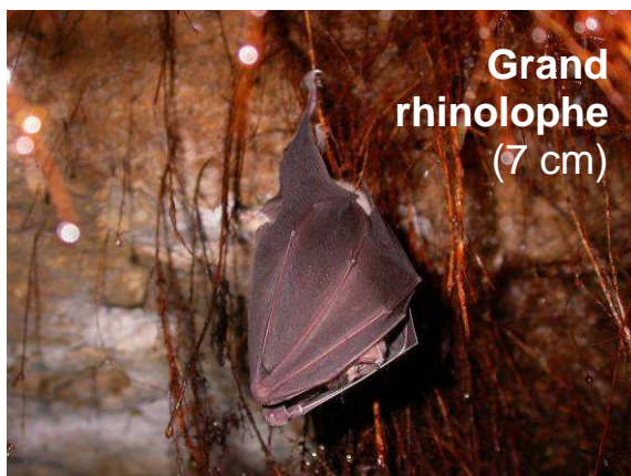
Grand rhinolophe (7 cm)