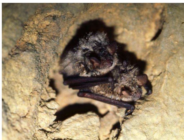
Le Murin à oreilles échancrées, une des espèces phare des Carrières des Chaudrolles