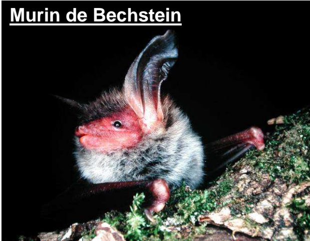
Murin de Bechstein