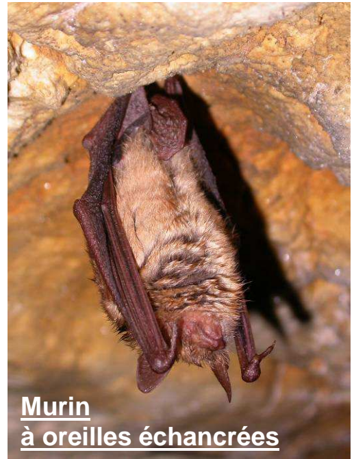
Murin à oreilles échancrées