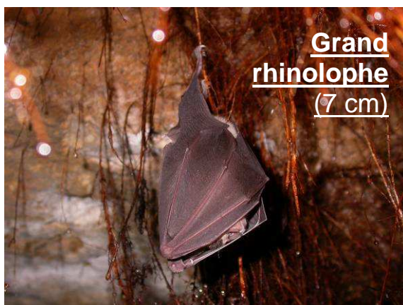
Grand rhinolophe (7 cm)