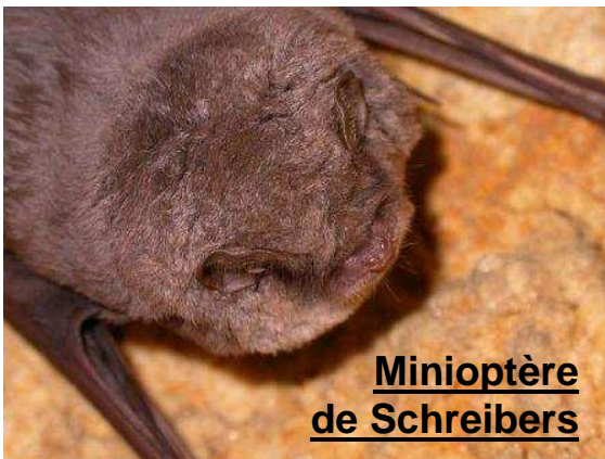
Minioptère de Schreibers